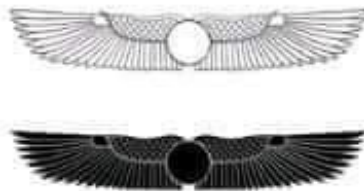
قرص الشمس المجنح