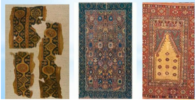
وللسجاد في العصر الإسلامي تصاميم وزخارف متنوعة

مصنع طراز أو أسلوب أو نمط وفي العصر الأموي أصبحت كلمة الطرازات مدلول سياسي فقد كان يطلق على شريط الكتابة ويثبت فيه اسم الخليفة.